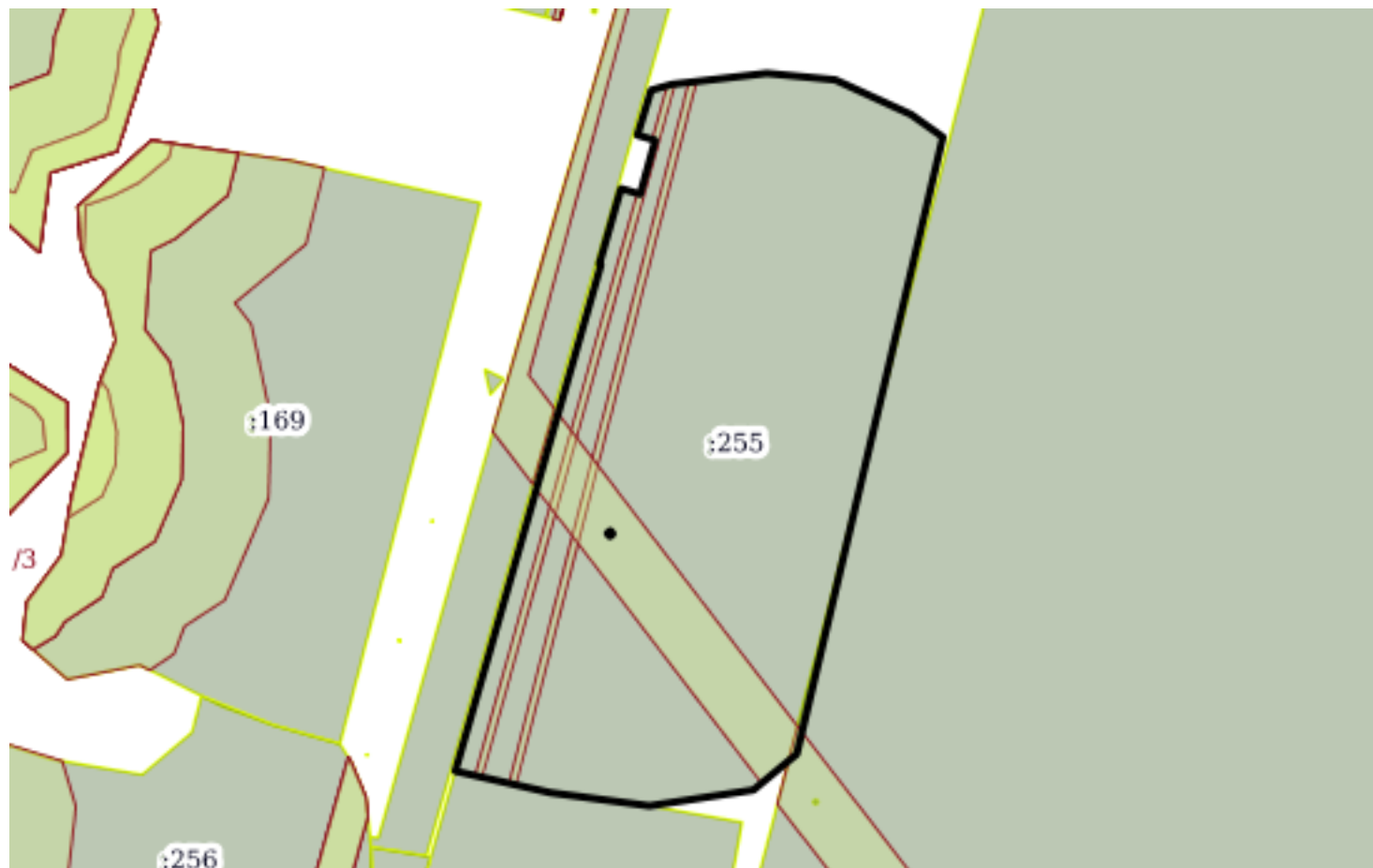
План (чертеж, схема) земельного участка